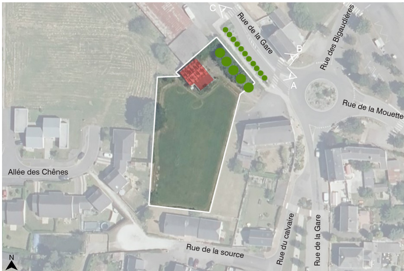
Site OAP - Zone 3