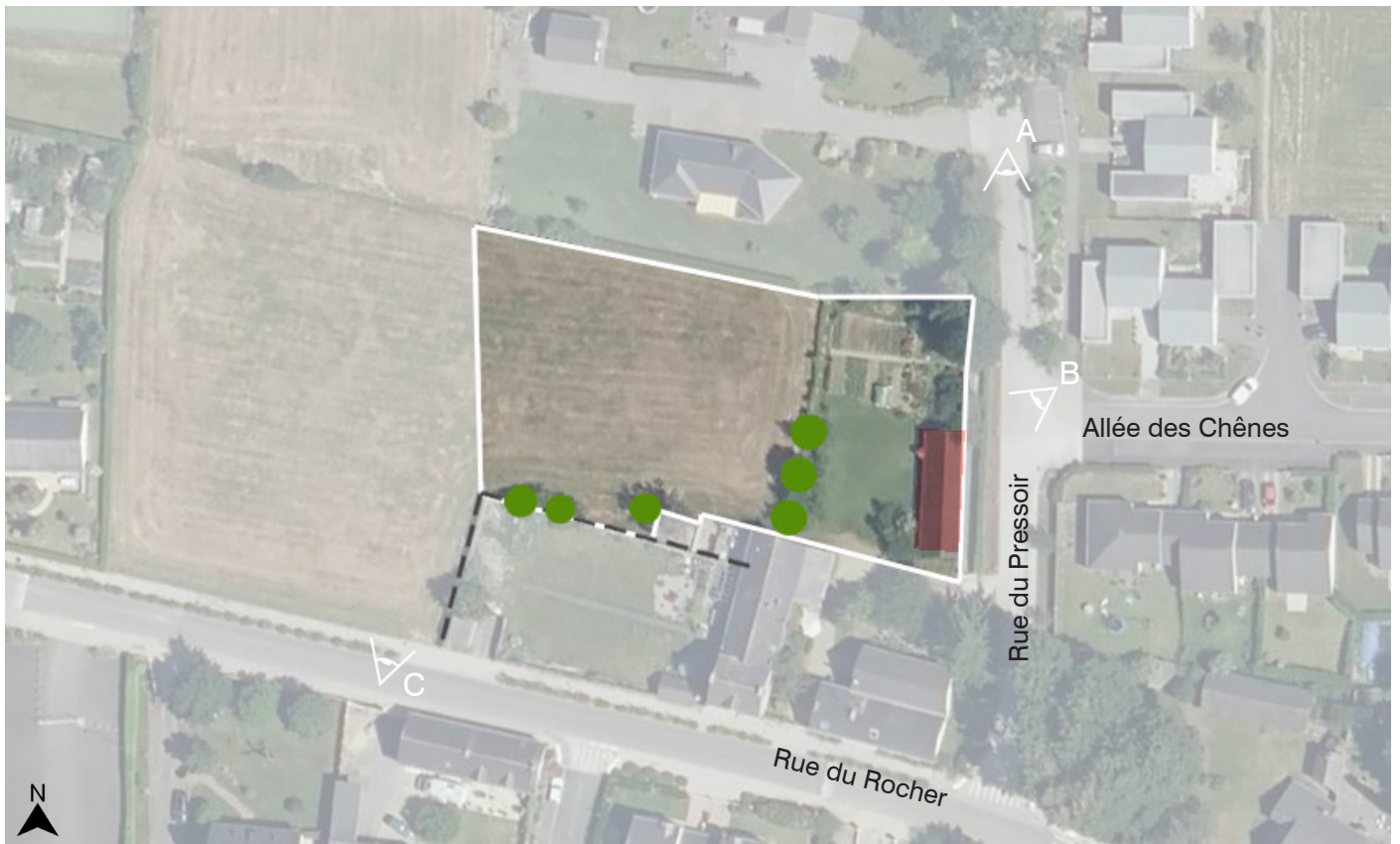
Site OAP - Zone 2