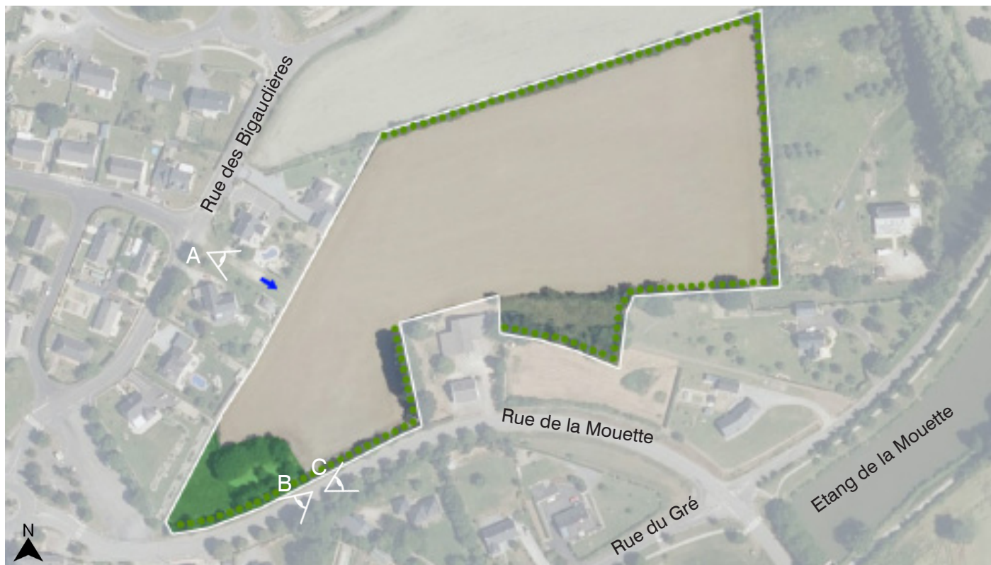
Site OAP - Zone 6