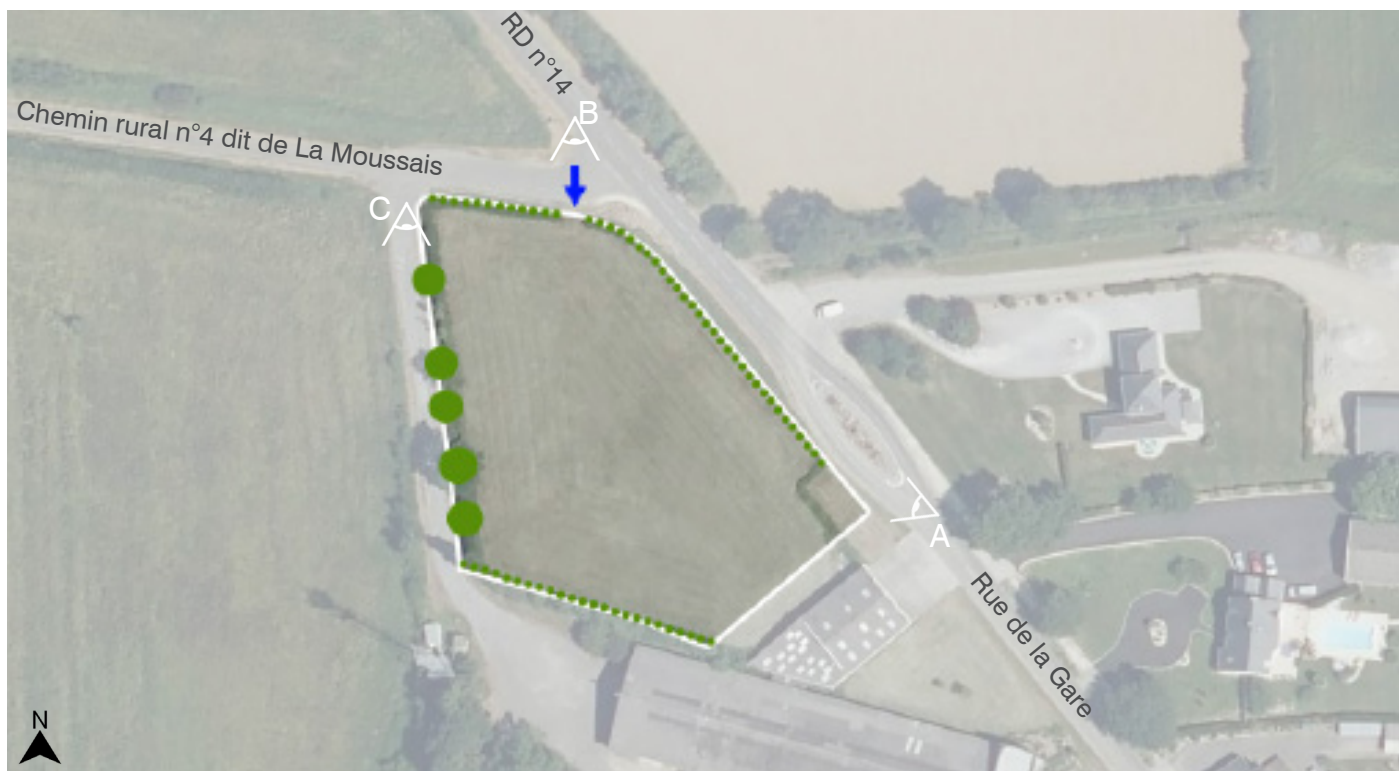
Site OAP - Zone 1