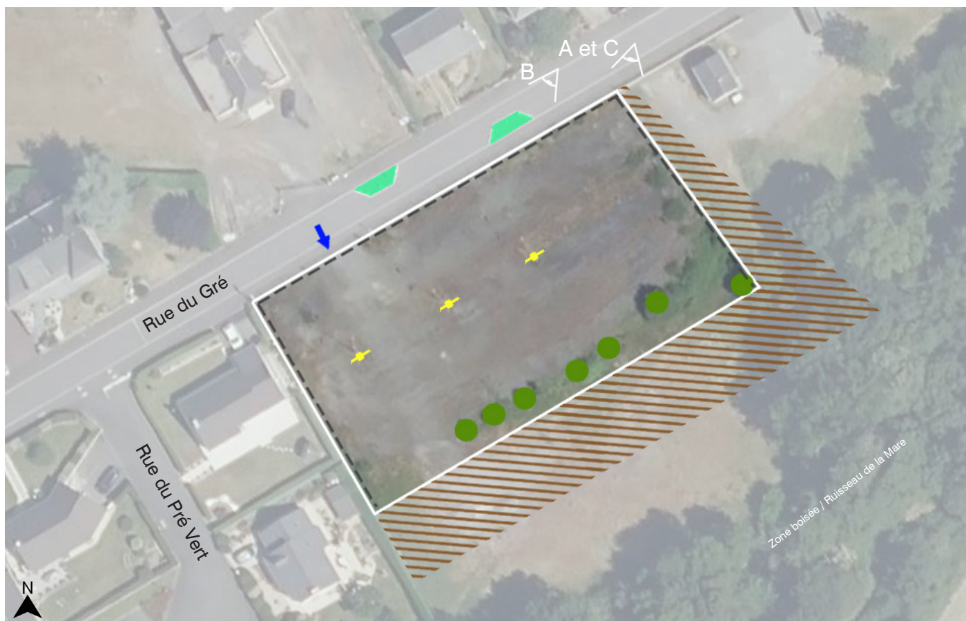
Site OAP - Zone 5