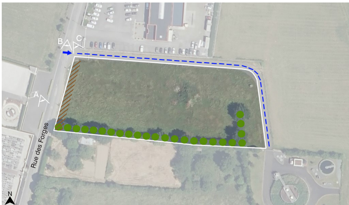
Site OAP - Zone 4